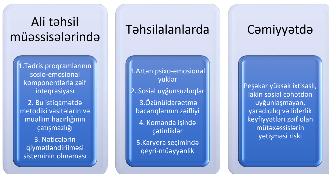
Şəkil 1.1. Ənənəvi və müasir təhsil sistemləri arasındakı ziddiyyətlər nəticəsində yaranan konkret problemlər

Bu ziddiyyət özünü konkret problemlərdə göstərir: